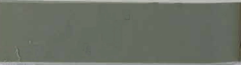
770 mittelgrau / gris moyen (1)