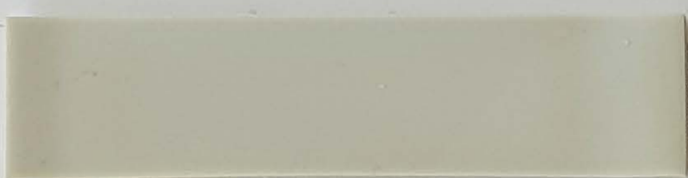
fugengrau / gris joint (1)