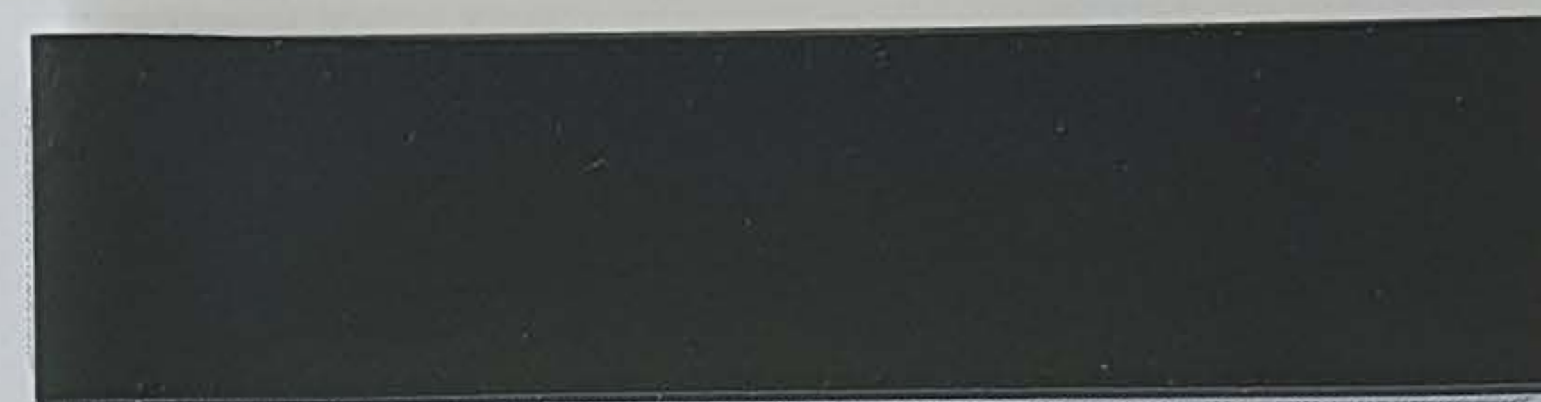
dunkelgrau / gris foncé (1)