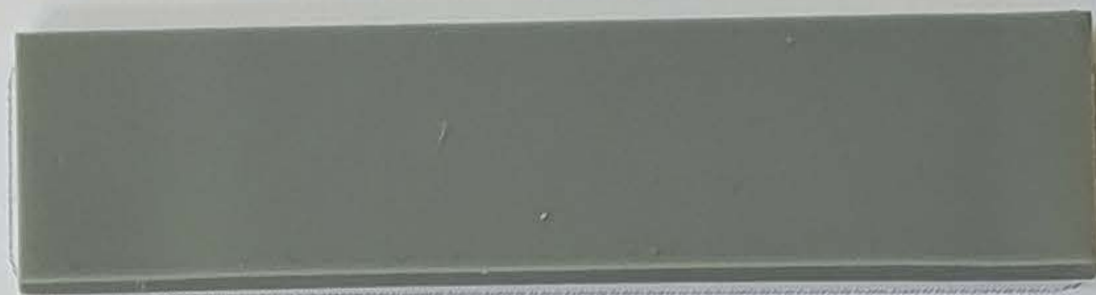
staubgrau / gris poussière (1)