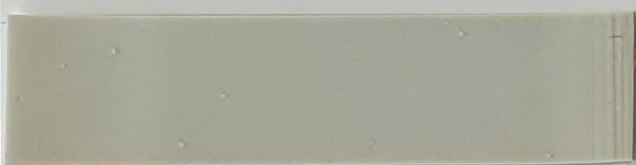
lichtgrau / gris lumière (1)