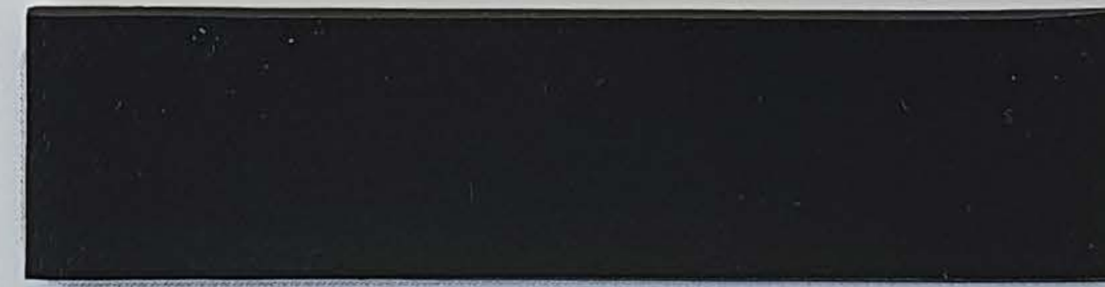
schwarz / noir (1)