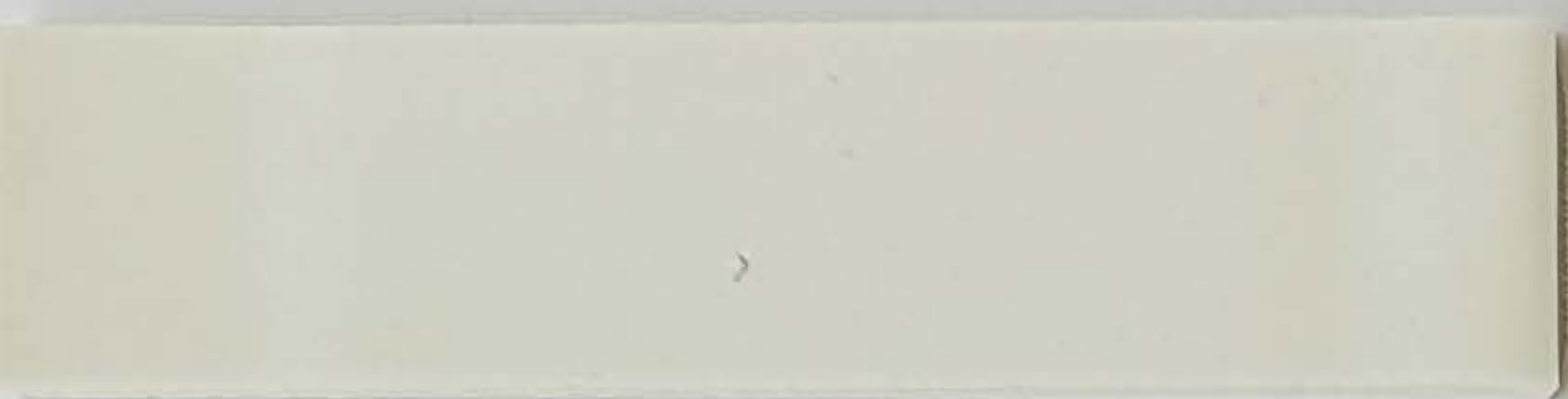
weiss / blanc (1)