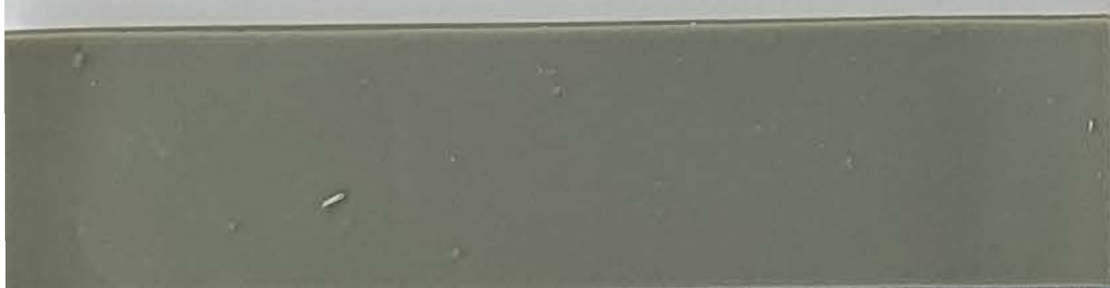
mittelgrau / gris moyen (1)