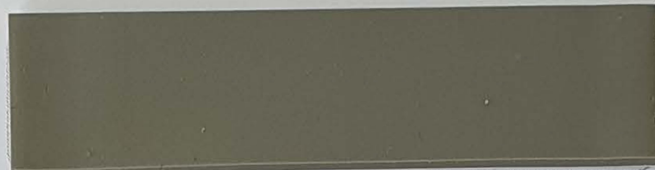
betongrau / gris beton (1)