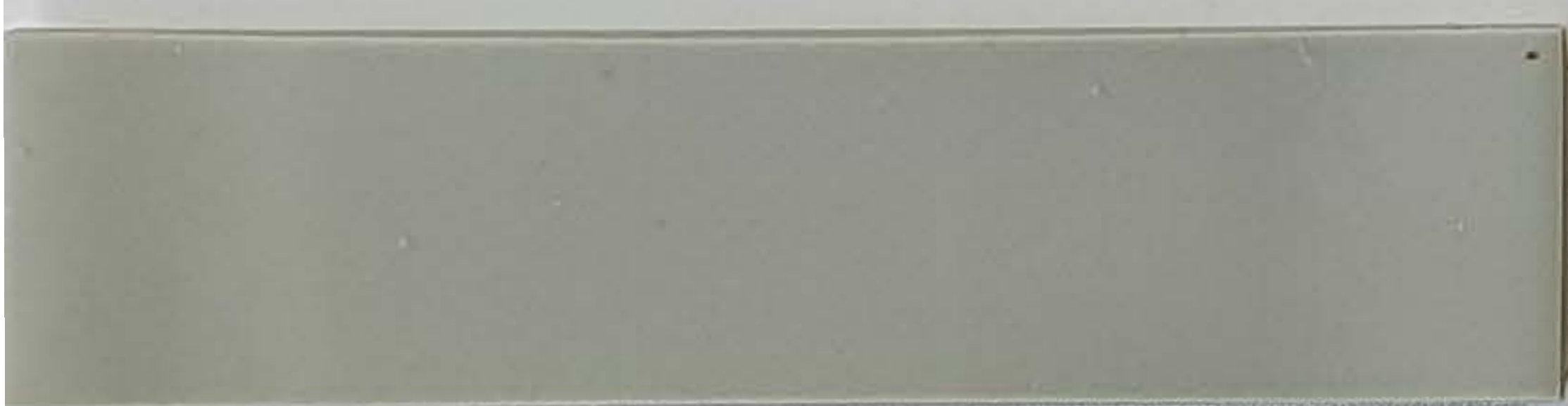
hellgrau / gris clair (1)