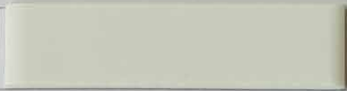
weiss / blanc (1, 3*)

Aufgrund vieler verschiedener Displaytechnologien und Displayeinstellungen sowie verschiedene Drucker, können die im Dokument dargestellten Farben vom Original abweichen und repräsentieren nur einen ungefähren Farbton.