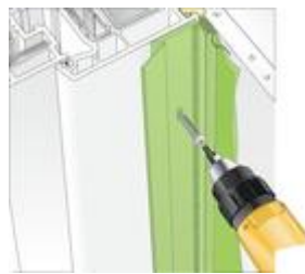
Bild2: Befestigung mit geeigneten Schrauben.