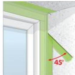
Bild3: Überstehende Folie mit dem Reißfaden unter 45° abreißen.