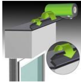
Bild 1: Band zweimal umklappen und innen bündig auf den Kasten kleben