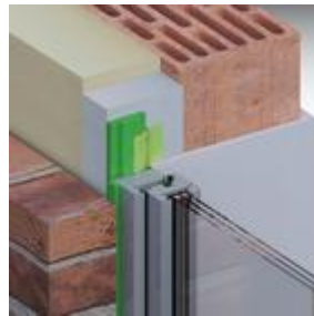
Lösungsmöglichkeit: ME350 Fensterfolie Innen VV FM230 Fensterschaum+ TP600 illmod 600