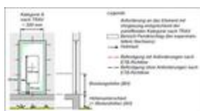
Bild 2: Anwendungsbeispiel 1 der Montage absturzsichernder Elemente