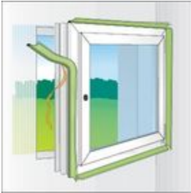
Bild 1: Befestigung des Selbstklebestreifens des TP001 illmod i am Rahmen.